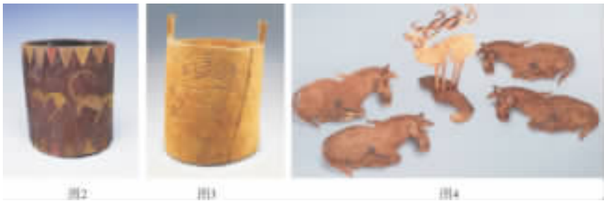
图 2 - 4 依次为洋海墓地出土小木桶(两侧带孔)、双耳小木桶和俄罗斯阿尔赞墓地出土金鹿、金马

沟出土的四座墓室也均为长方形竖穴 [2]18 。位于苏联阿尔泰山北的巴泽雷克墓地的马鞍中也填充鹿毛,并且也是竖穴墓,甚至连陈尸的尸榻也非常相似。在这个墓地里随葬的弓和弓弦同洋海墓地一样也是故意折断的。这些文化特征与洋海中期的文化相对应。阿尔赞 2 号王墓中发现的斯基泰人文身习俗,在洋海墓地也有发现 [1]147 。其次,从人种学的角度来看,洋海人颅骨形态的综合特征明显倾向于高加索人种系列,其中 2/3 近于古欧洲类型,1/3 近于地中海类型;前二期的居民没有大的变化,是一个相对稳定的群体。后期虽有蒙古人种因素的明显增加,但不足以改变基本的综合体 [1]147 。综合以上因素,可以判定洋海墓地是斯基泰人文化遗存。